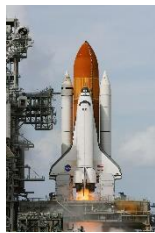
a space rocket