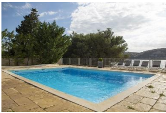
a swimming pool