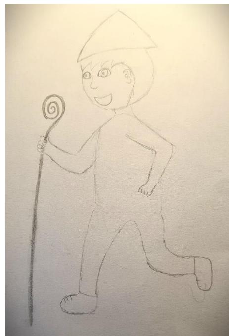
SLIKA 5: Logo avtorica: Nika Nedeljko