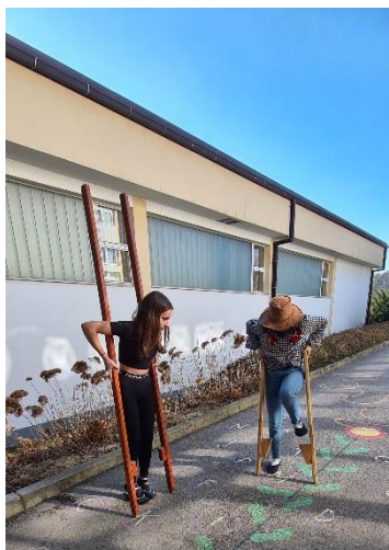
SLIKA 7: Hoja s hoduljami je težka

Z veseljem pričakujemo Turistično tržnico, ki bo za vse nas nekaj novega!