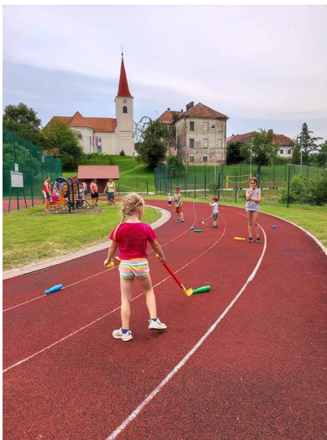
SLIKA 1 : Otroške igre brez meja na Športnem parku, organizator DPM Sveti Tomaž https://www.facebook.com/photo.php?fbid=491988656292

PRIJAVNINA: 3 € na otroka (če želi sodelovati za nagrade), drugače je udeležba brezplačna.