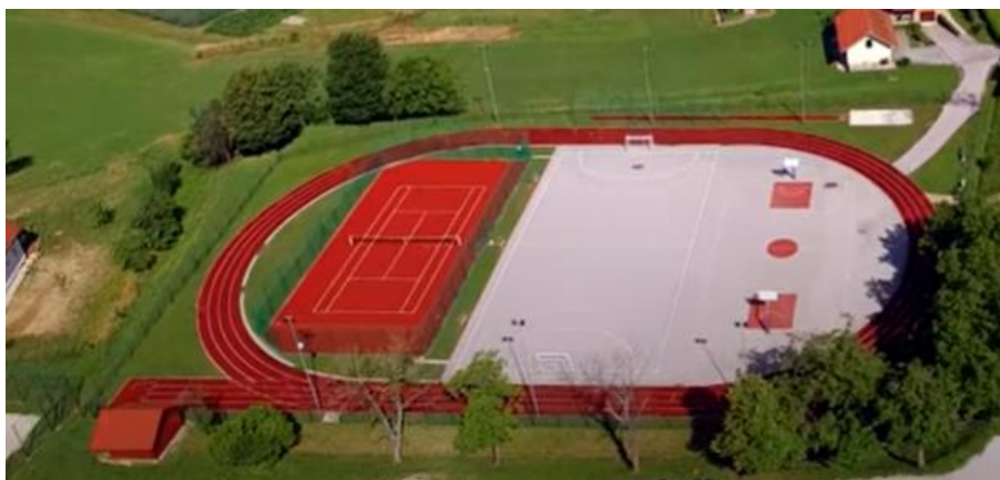
SLIKA 4: Pogled na Športni park v Svetem Tomažu iz zraka VIR: https://www.youtube.com/watch?v=2FJE7UjKsBk

IGRA: Vsi štirje igralci se postavijo v krog tako, da si kažejo hrbte in se primejo s komolci. Po določeni črti se premikajo do sode s »krompirjem« (krogle iz blaga). Prvi vzame en »krompir«, krog se zavrti, nato vzame krompir naslednji, dokler vsak ne drži en krompir. Nato se po naslednji črti pomaknejo do mize z vrči (ozek vrat) in na vsak vrat vrča postavijo en krompir. Pri tem se morajo seveda zavrteti. Če se vrč prevrne, ali krompir pade, se morajo nekako dogovoriti, kako ga bodo pobrali, brez, da bi se spustili s komolci. Mize so tri, zato morajo igro ponoviti še dvakrat. Paziti morajo na črte, ki jim sledijo. Zmaga najhitrejša ekipa, ki pravilno prenese ves »krompir«,