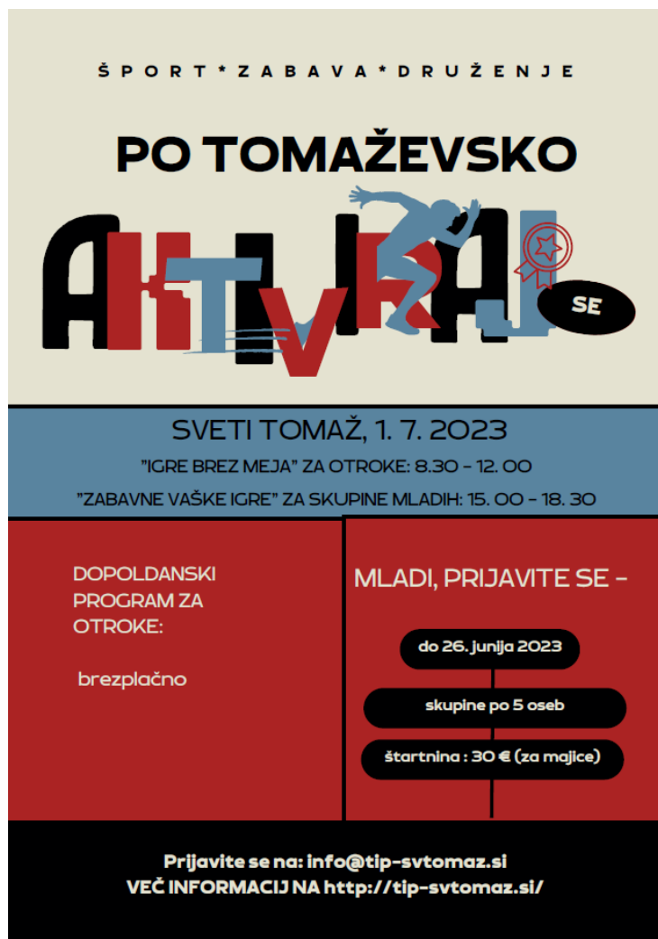
SLIKA 6: Plakat avtorji naloge

Vodilne barve bodo modra, črna in rdeča.