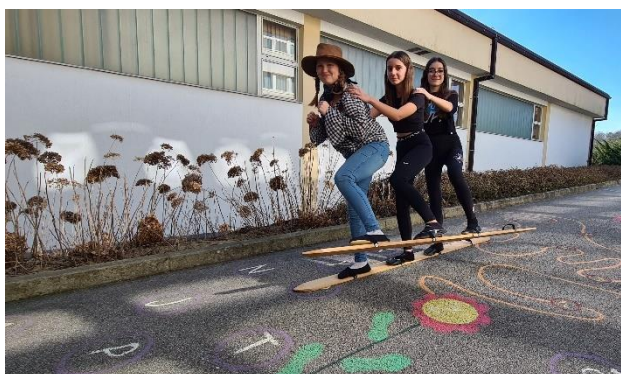
SLIKA 8: Test smučī opravljeno